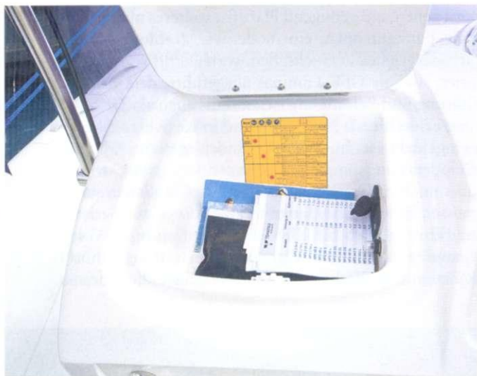
Kleinigkeiten können am Fahrstand untergebracht werden. Auch eine 12-Volt-Steckdose ist vorhanden

Obwohl er das Limit des Bootes bei weitem nicht ausreizt, macht der Tohatsu MD 115 eine gute Figur an der BRIG Eagle 645. Immerhin reicht die Motorisierung für eine Höchst-