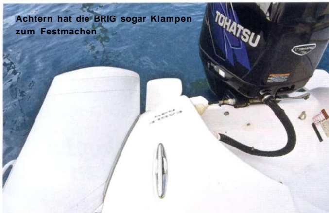
Achtern hat die BRIG sogar Klampen zum Festmachen

Sulfat-Polyethylen), das vielen sicher unter der DuPont Marke Hypalon bekannter ist, geordert werden. Ansonsten gibt es keine Unterschiede. Beide Versionen besitzen fünf Luftkammern und einen sehr anständig verarbeiteten Fiberglas-V-Rumpf. 450 Kilogramm bringt das geräumige Boot auf die Waage. Dazu kommt der Motor, der bis zu 250 Kilogramm wiegen darf. Eine leicht trailerbare Kombination also. Die BRIG Eagle 645 mit dem Tohatsu MD 115 wurde uns für den Test freundlicherweise vom Fachhändler Bernd Stockmann zur Verfügung gestellt, der mit der Hollenbach GmbH & Co. KG ab 2010 den Vertrieb der BRIG-Boote übernimmt.