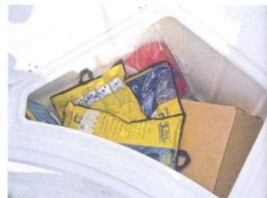
Auch im Bug finden wir weitere Stauräume für Zubehör