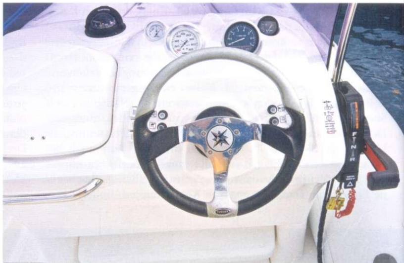
Sauber und aufgeräumt geht es am Steuerstand zu. Die Instrumentierung ist gut ablesbar