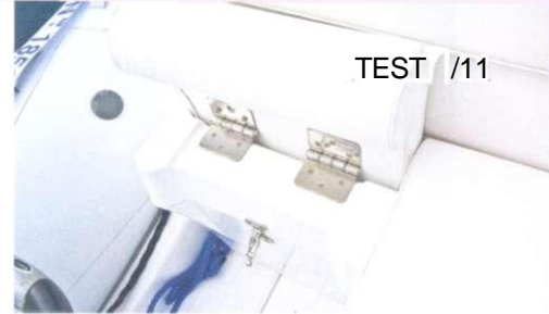
Die Sitze für den Steuermann und Beifahrer sind einzeln verstellbar