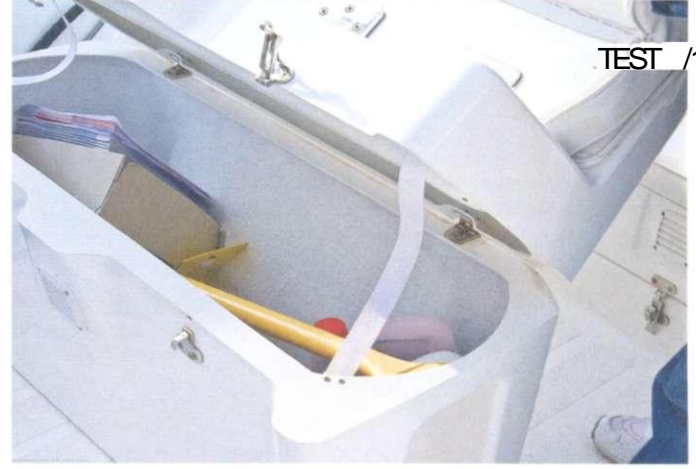
Unter dem Fahrersitz befindet sich ein weiterer großer Stauraum

geschwindigkeit von gut 31 Knoten. Mit der vom Hersteller empfohlenen Antriebsleistung sollte hier aber klar eine vier an der ersten Stelle stehen. Auch die Gleitfahrt ist mit der Test-