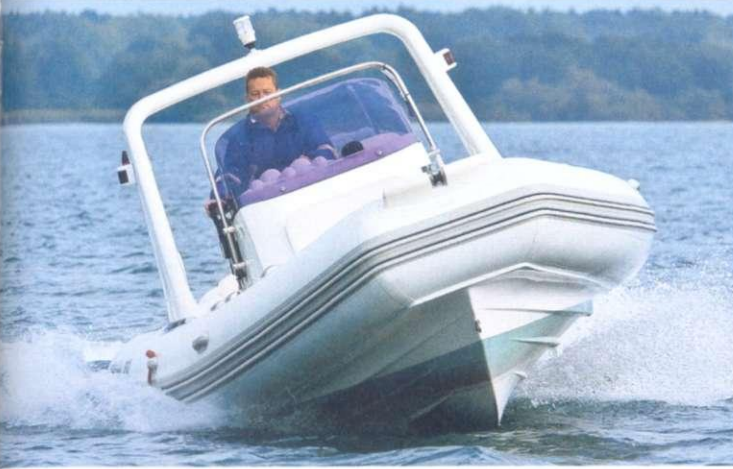
Die BRIG Eagle lag mit der Testmotorisierung stets stabil im Wasser