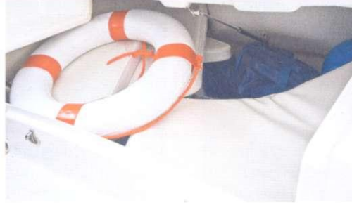
Unter der Rückbank befindet sich ein großer Stauraum für allerlei Utensilien