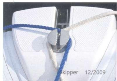
Praktisch ist der eingeklebte Bugspriet aus GFK