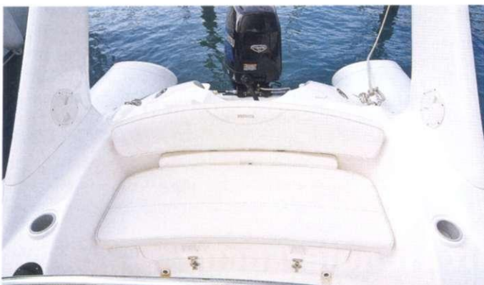
Die bequeme Rückbank nimmt bis zu drei Gäste auf