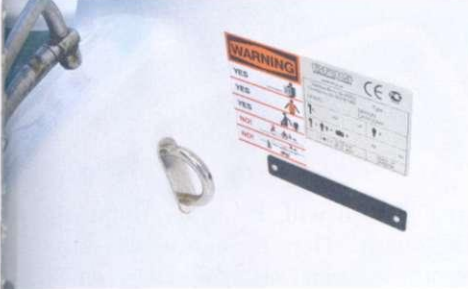
Immerhin 13 Personen darf die BRIG laut CE-Kategorie C tragen