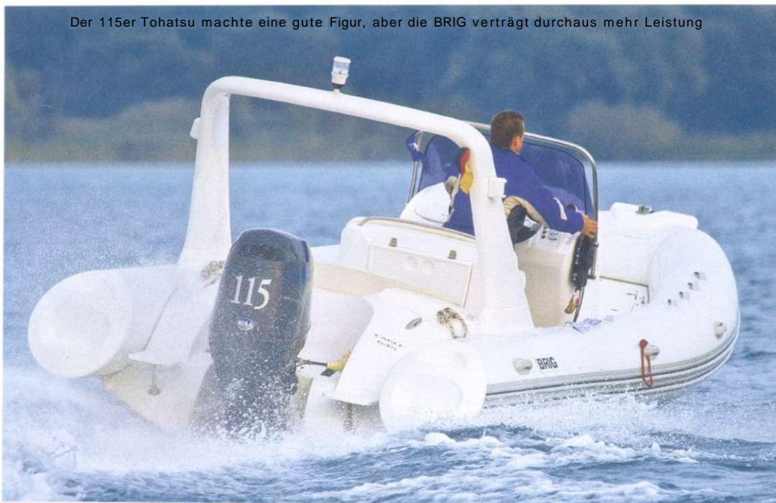
Der 115er Tohatsu machte eine gute Figur, aber die BRIG verträgt durchaus mehr Leistung